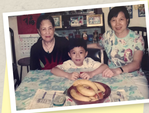
與曾孫合照，太婆多開心呀！