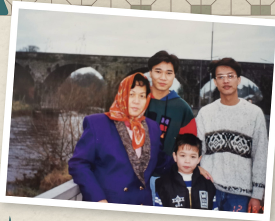
擺酒後同媽媽及哥哥去了外國哥哥家度假。