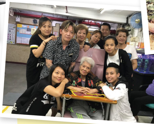
這一幅呂姐當時仲認得我們的