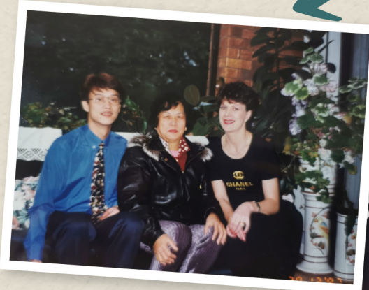
這是在媽媽新抱姊妹家裡。