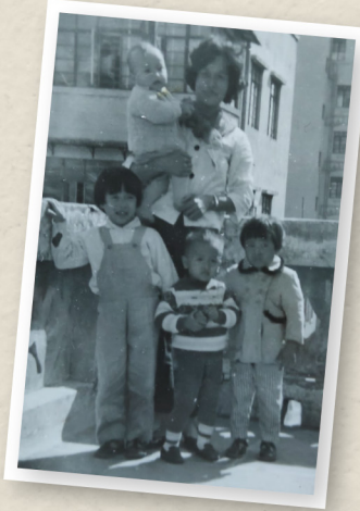
約六十年前，婆婆於旺角天台與四個子女的合照。一家人住在天台木屋。