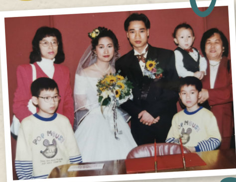
1997年，細女在金鐘紅棉路註冊結婚。