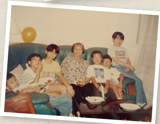
亦明院友與孫輩同樂(94年5月, 68歲)