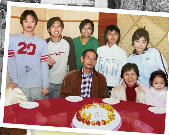
當年爺爺70歲生日同孫仔孫女合照。爺爺嫻嫻當時睇落仲很年輕啊，啲孫仔孫女現在已經大個囉啦。