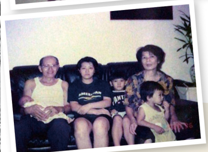
呂姐和孫仔孫女一些點滴