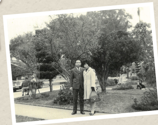
寶華和丈夫澳門遊