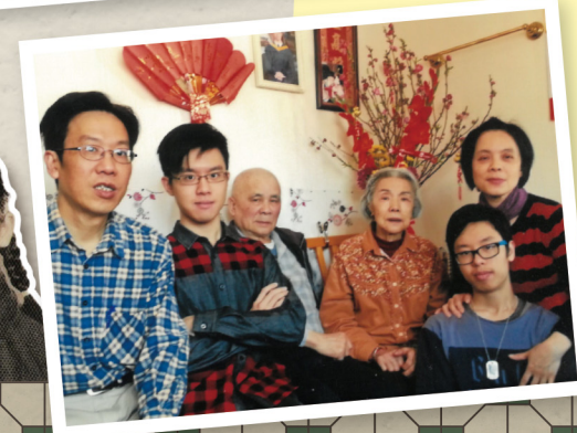
大女兒一家同公公婆婆