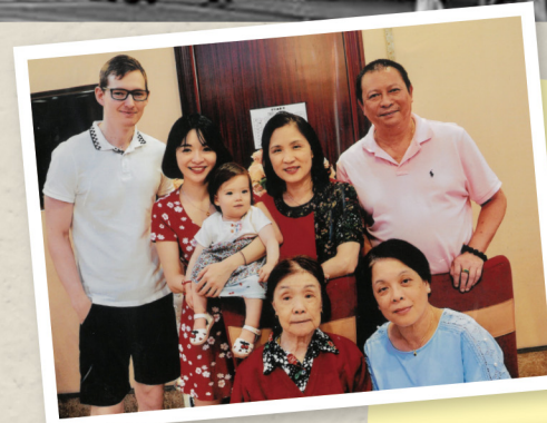
二女兒一家四代同堂