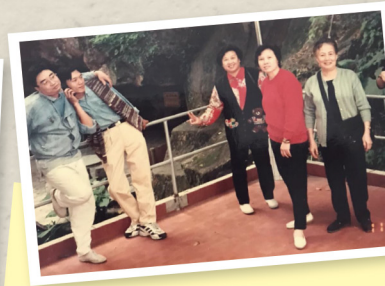
97年我的大家姐及姨甥一行開車到西樵美玉家鄉尋根。