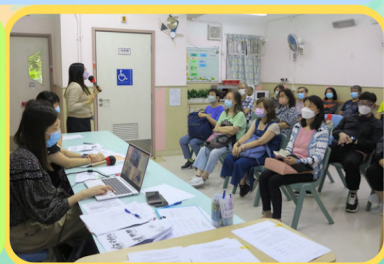
會議於地下飯堂進行