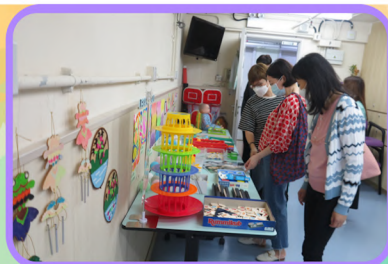
二樓活動室：藝術物資、日常認知訓練工具介紹