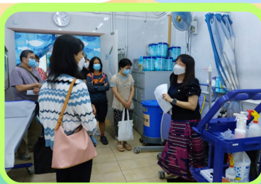
地下沐浴間：轉移設備講解