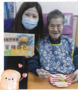
軟餐下午茶：蜜糖麵包

「精緻軟餐」意指把糊狀食物以不同模具塑造成接近食物原型（如豬、雞、魚等）的造型，一來從形狀可辨別食物種類，二來吸引的賣相有助提升長者進食的興趣。研究顯示進食精緻軟餐能減少長者拒餐次數，有效協助長者維持體重、增加食量。