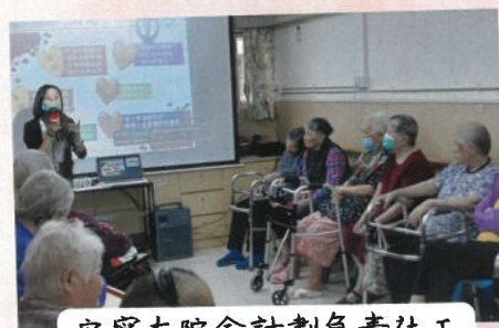
安寧在院舍計劃負責社工在院友大會中進行講解。

計劃負責社工及護士近月分別於本院之院友大會及家屬會議講解晚晴照顧計劃內容，並為職員進行相關內容之培訓，讓院友、家屬及職員三方均為長者之晚晴照顧有更好的預備及了解。