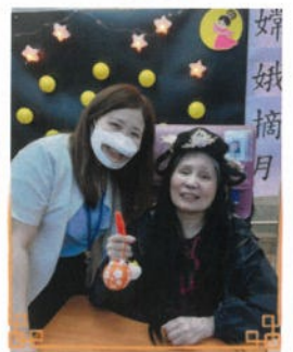
中秋的月亮又圓又大！