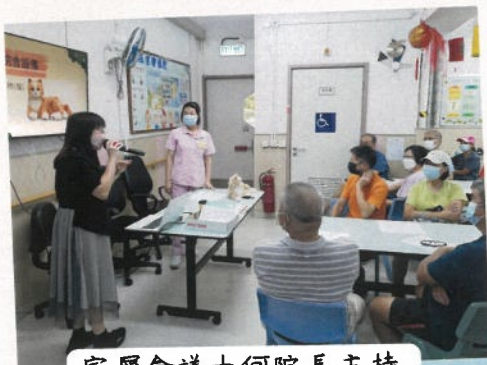
家屬會議由何院長主持並向家屬匯報院務。