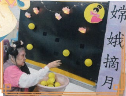
看！我把天上的月亮摘下來了！