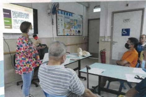
安寧在院舍計劃負責護士於家屬會議，向家屬講解有關晚晴照顧內容。