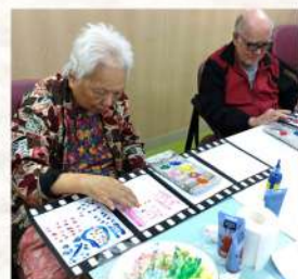
人生菲林格： 組員用手在菲林 格上一點一滴， 回顧人生。