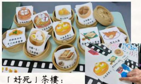
「好死」茶樓： 討論對「好死」的看法。