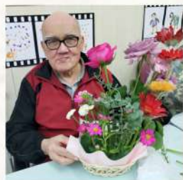
插花活動： 組員寫上想 對自己說的 說話。

小組內，長者回顧人生，一起討論晚晴照顧的心願，當中發現長者對維生治療、晚晴階段的處所、後事地點等都帶著疑問。而且長者有時也下不定主意，但透過小組，他們有機會將疑問帶出及獲得解答，亦鼓勵長者盡早表達意願，對於日後家人為長者作晚晴決定時有一定幫助。本院參加了賽馬會安寧頌--安寧在院舍計劃，參加計劃的長者及家人會與職員一同計劃及商討晚晴照顧的意願，希望可以尊重長者意願，讓長者安寧離世。