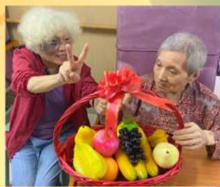
遊戲：中秋送大禮之製作果籃