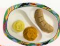
院舍廚師製作的軟餐

院方回應： 為了確保長者的進食安全，我們會保持食物質地較軟 和易吞。我們也會加些院友喜歡的味道提升食欲。 院舍同時提供精緻軟餐，希望能夠提升老友記對進食 的興趣。