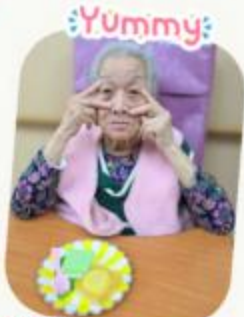
軟餐奶昔月餅&斑蘭糕